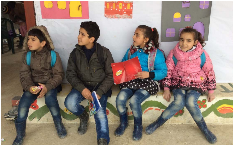
Vista exterior de la escuela de Nahrya